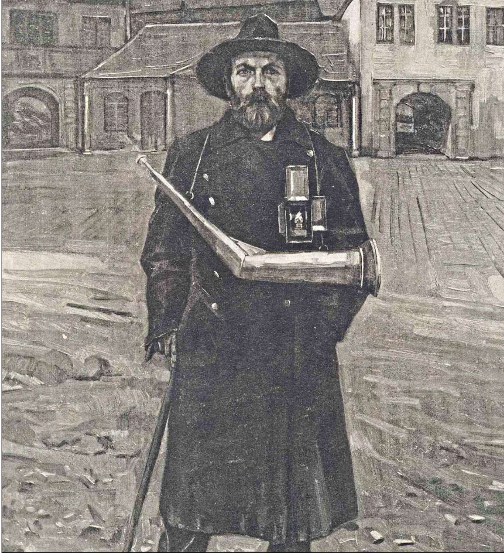
Ausgerüstet mit dem einer Uniform gleichenden langen Mantel und dem breitkrepigen Hut, mit Laterne, Horn und einer als „Hellebarde“ bezeichneten Stoßwaffe war der Nachtwächter nicht nur für die Sicherheit zuständig. Auf den nächtllichen Gassen hatte er auch für Ruhe zu sorgen. Kein unnötiger Lärm sollte den Schlaf seiner Mitbürger stören – hier dargestellt auf einem Bildnis um 1900.

Doch bei allem Respekt, den man der verantwortungsvollen Tätigkeit des Nachtwächters entgegenbrachte: Er sah sich oft in die Rolle des Außenseiters gedrängt. Denn im Gegensatz zu den auch während der Nacht hell er-