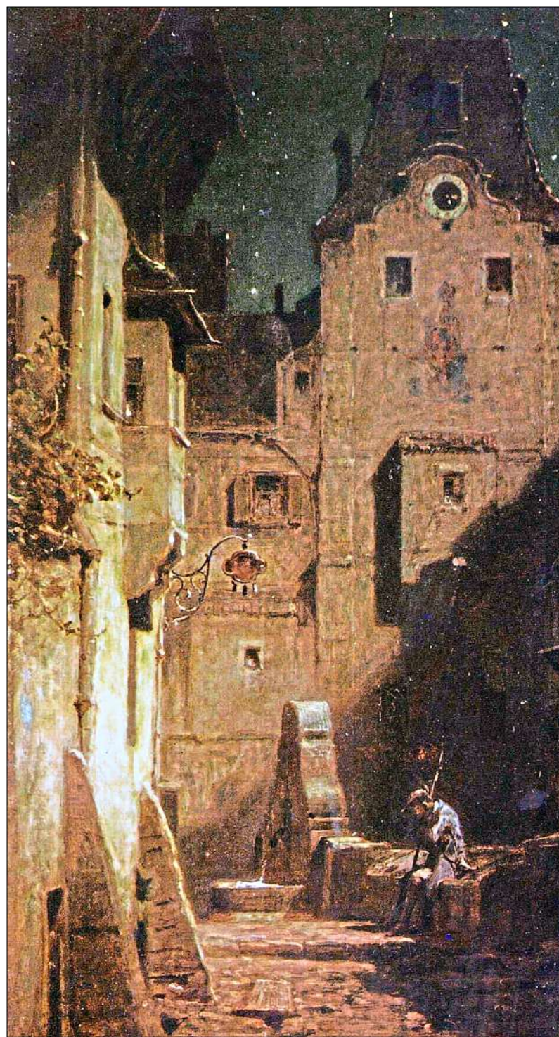
Selbst wenn seine Stadtrundgänge meist ohne Vorfälle verliefen und es oft darum ging, Raufereien Betrunkenere zu beenden, wurde dem Nachtwächter doch einiges abverlangt. Einschlafen, wie auf der Darstellung, dürfte er nicht. – Foto: Repro, Carl Spitzweg: „Der eingeschlafene Nachtwächter“, um 1875, Kurpfälzisches Museum Heidelberg, Public Domain, Quelle: Wikimedia Commons

An die Zeit, als Nachtwächter auf den finsternen Straßen der Städte eine unentbehrliche Rolle spielten, erinnern heutzutage oft als Nachtwächter verkleidete Stadtführer. Bei abendlichen Rundgängen geben sie interessierten Touristen Einblick in die