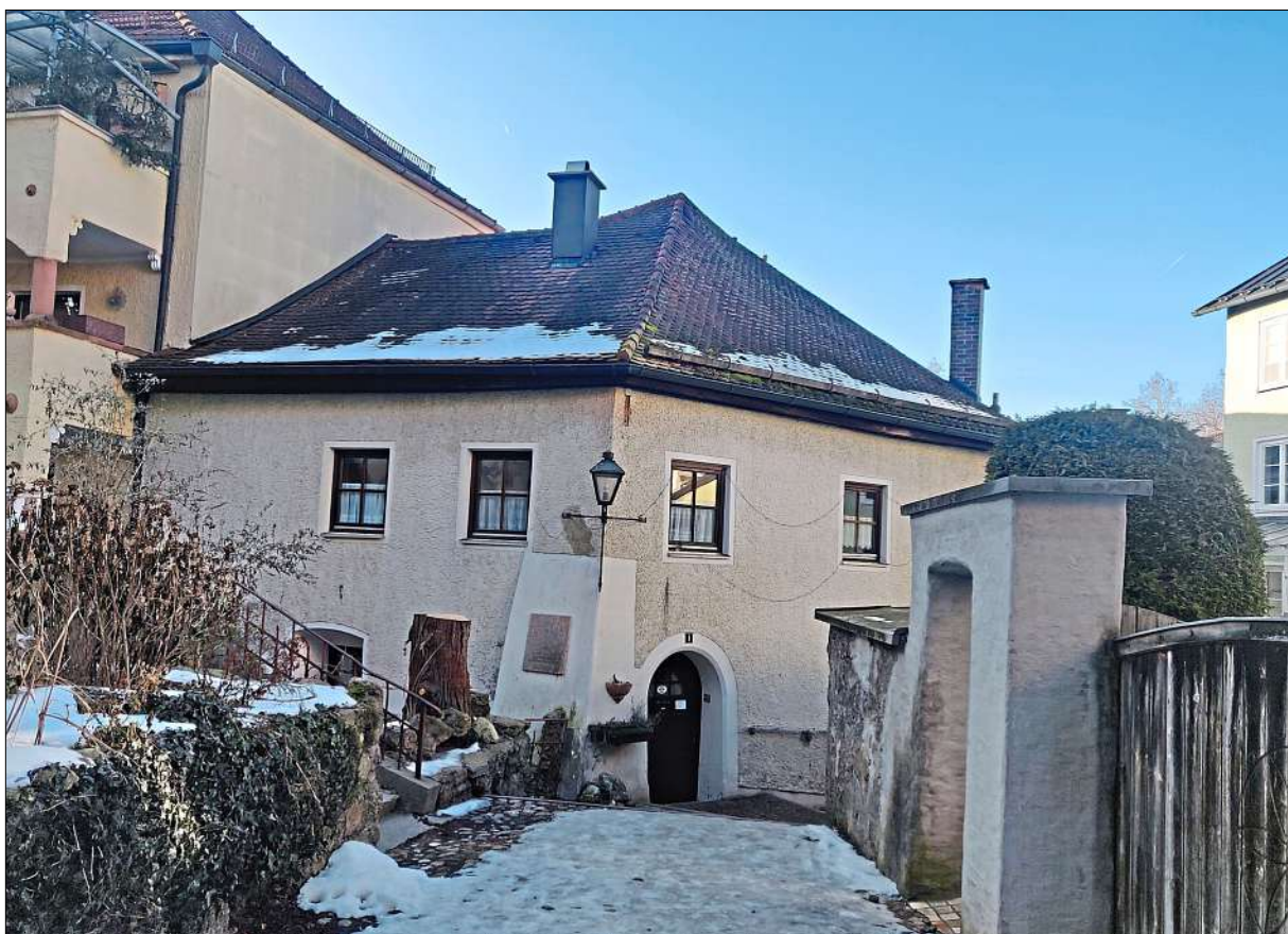
Nachwächterhaus in Laufen: In der Nachwächterverordnung von 1865 sind die Verpflichtungen niedergeschrieben, die das Amt mit sich brachte.